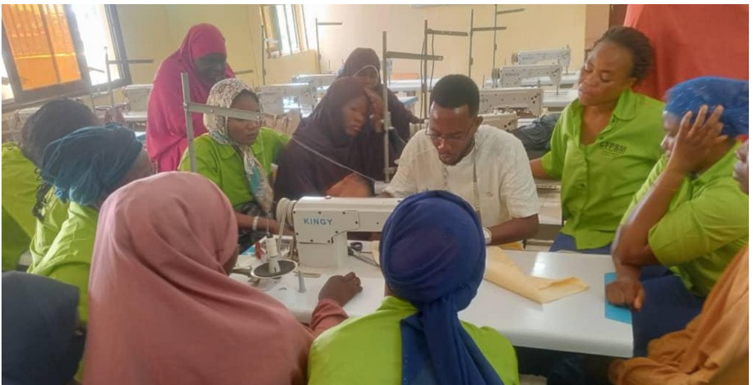
Cycle de formation professionnelle initiale en couture

En guise de contribution pédagogique, les experts ont organisé un premier atelier créatif de fabrication d'accessoires féminins, comprenant la préparation des matériaux, des patrons en papier et le choix des tissus. Les élèves ont été divisés en deux groupes avec pour objectif la réalisation d'une jupe. L'atelier a été un succès : chaque groupe a fait preuve de créativité pour réaliser cet accessoire féminin. Le deuxième atelier avait pour but de réaliser une chemise afin de montrer aux élèves quelques méthodes de travail, suivi d'un exercice de couture droite et propre.