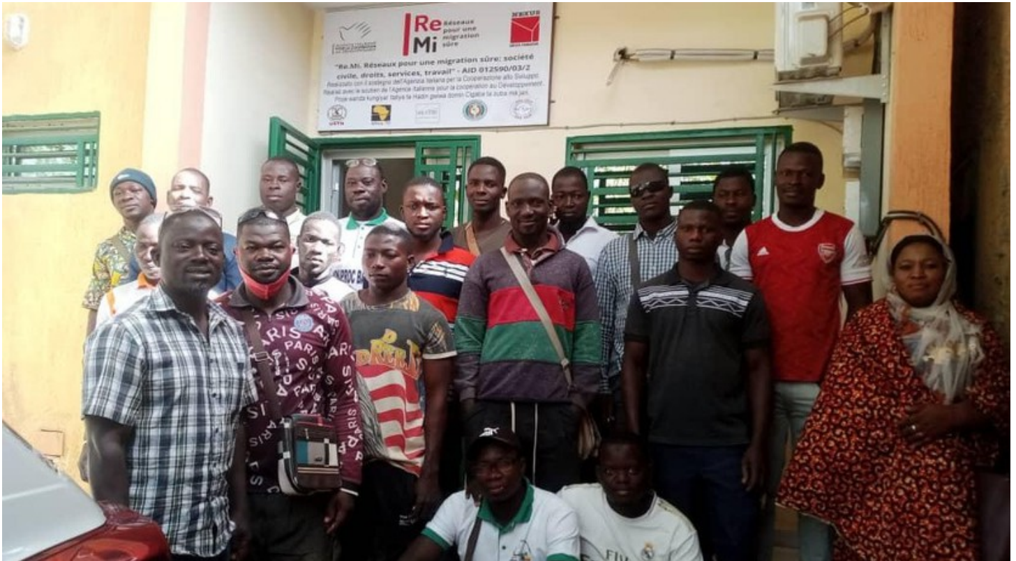
Bureau d'assistance pour l'orientation sur la mobilité régulière, le travail, les services locaux et la protection juridique