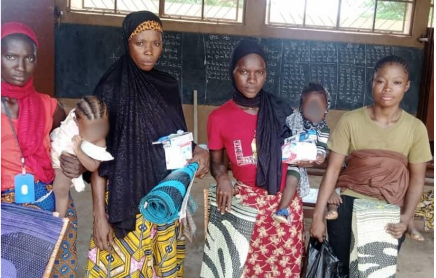
Distribution de nourriture et de kits d'hygiène