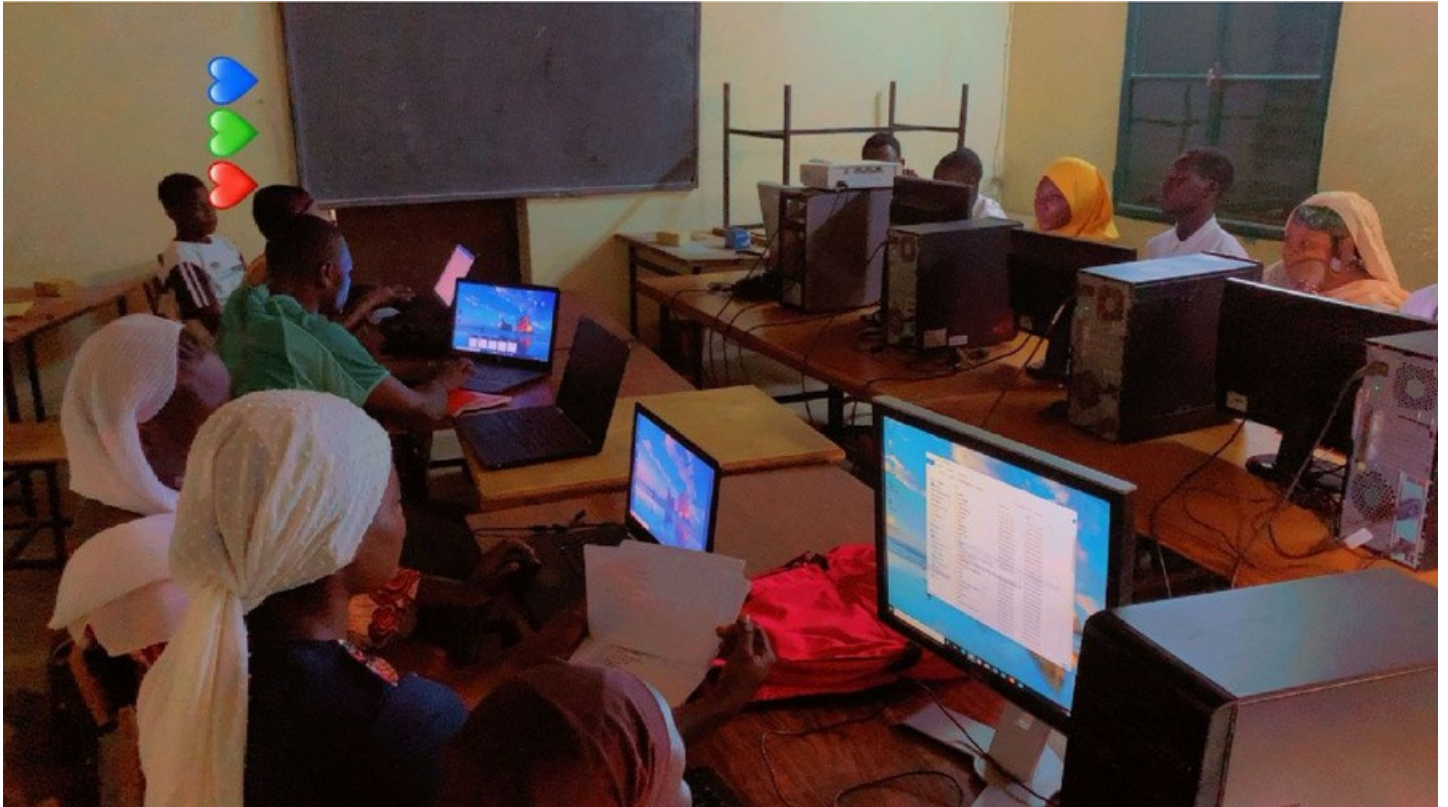
Cycle de formation à l'introduction aux techniques informatiques