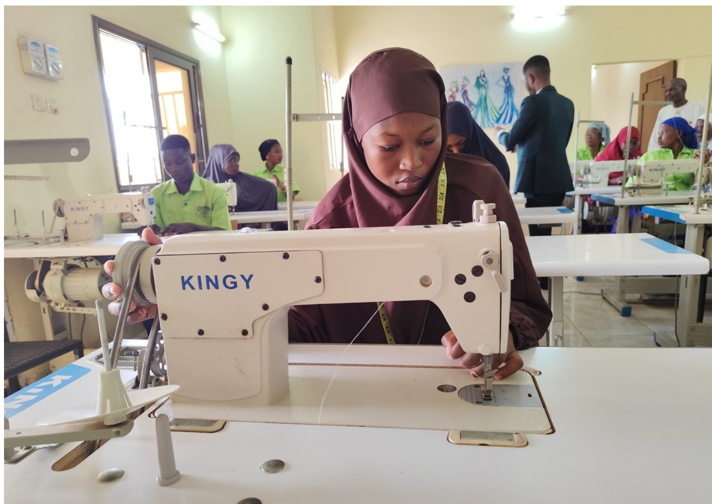
Cycle de formation professionnelle initiale en couture

35% des participants sont des migrants de retour du Niger , tandis que les nationalités les plus représentées parmi les migrants sont le Togo avec 17% et le Bénin avec 12% . Au total, 14 nationalités sont représentées