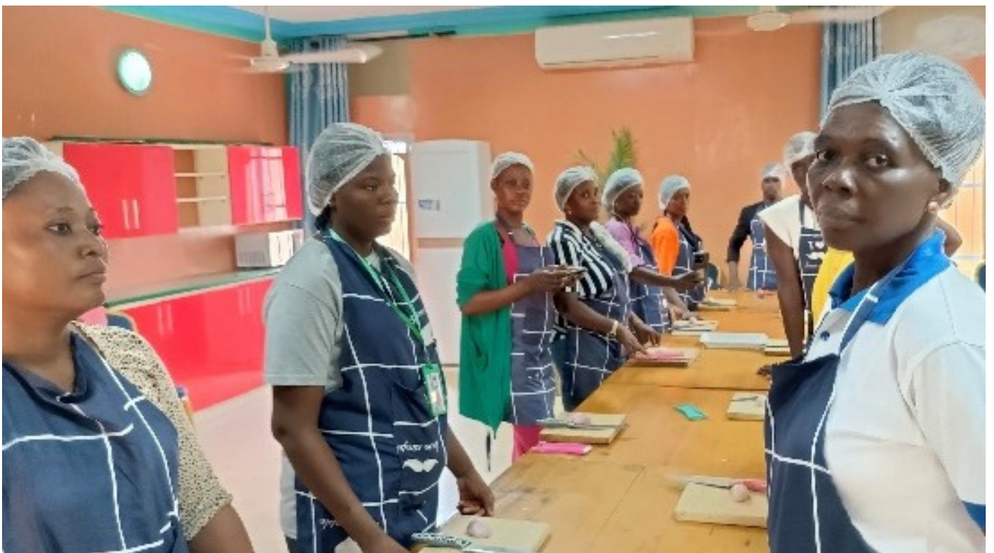
Cycle de formation en technologie de la restauration