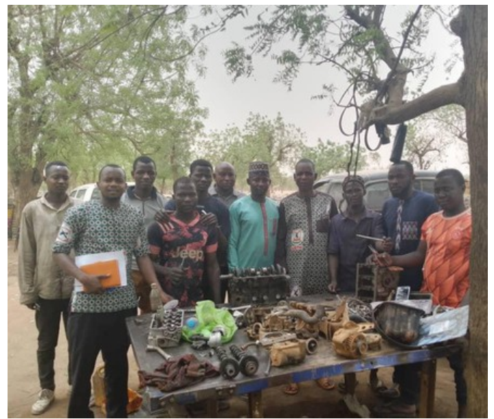
Réunions des groupes de travailleurs migrants