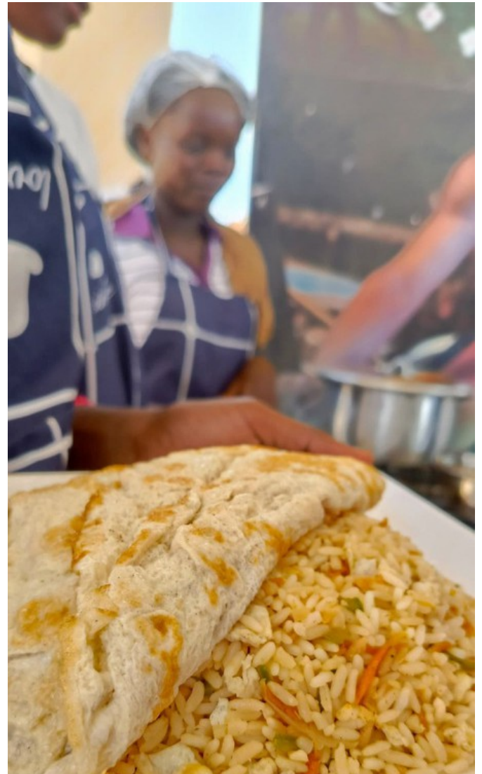
Cycle de formation en technologie de la restauration