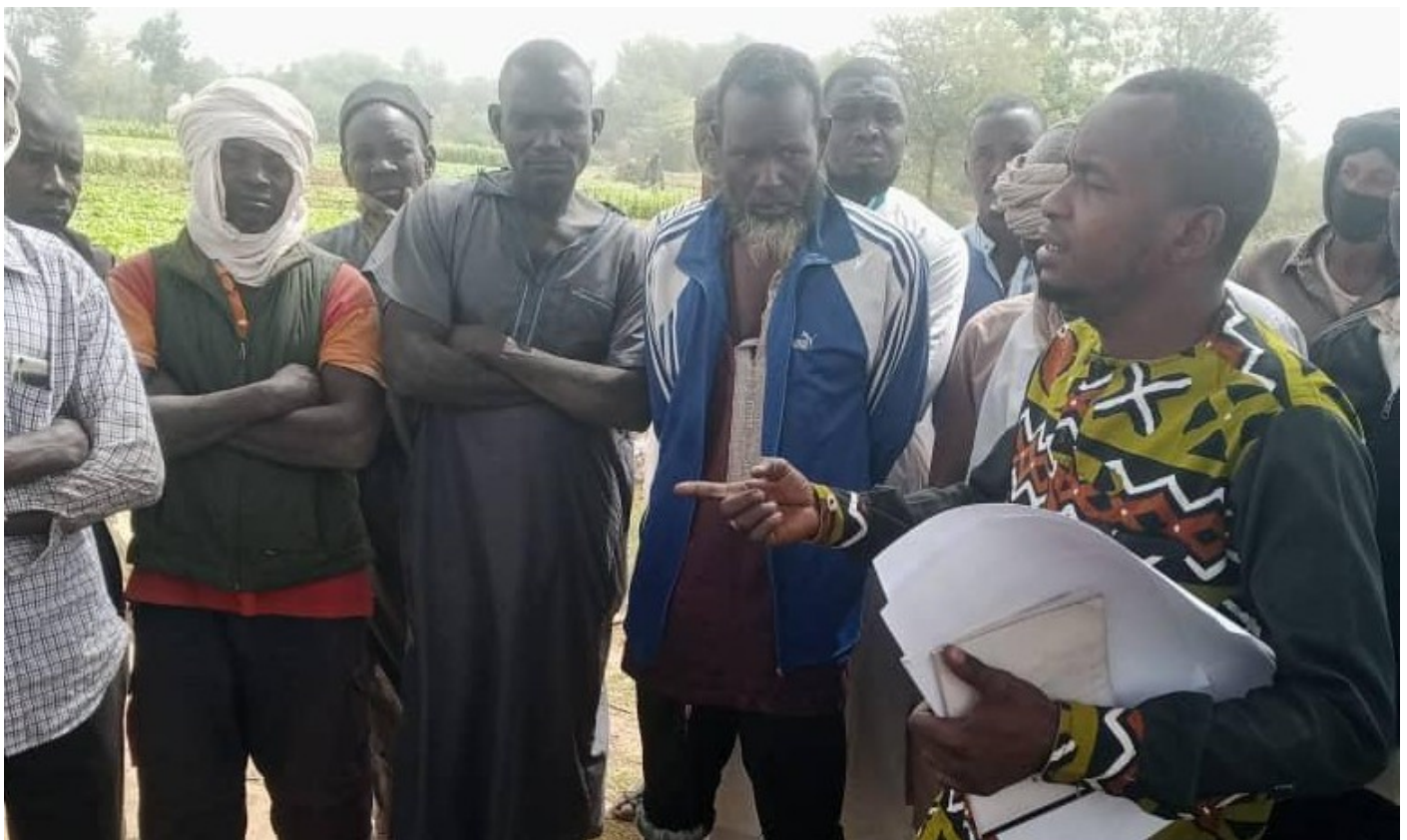
Rencontre avec un groupe de travailleurs migrants