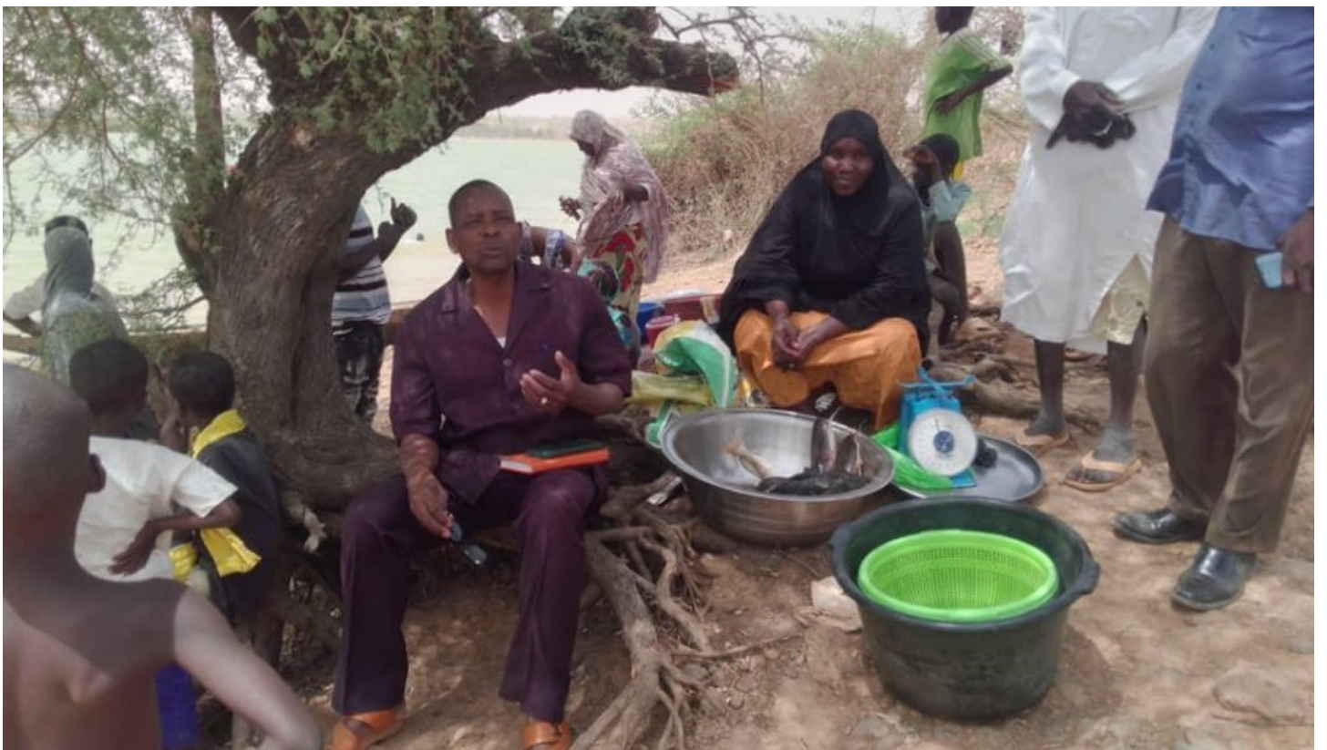
Rencontre avec un groupe de travailleurs migrants